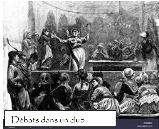
Débats dans un club

La Commune a renversé le pouvoir d'État bourgeois. Ses membres les plus combatifs et les plus conscients ont formé un nouvel État. Pour que celui-ci reste sous contrôle populaire, « La Commune employa deux moyens infaillibles. Premièrement elle soumit toutes les places d'administration, de la justice et de l'enseignement au choix des intéressés par l'élection au suffrage universel, et, bien entendu, à la révocation à tout moment par ces mêmes intéressés. Et, deuxièmement, elle ne rétribua tous les services, des plus bas aux plus élevés, que par des salaires que percevaient les autres ouvriers. » (Dira Friedrich Engels, fondateur de la I o Internationale Ouvrière et rédacteur avec Karl Marx du « Manifeste du Parti Communiste »)