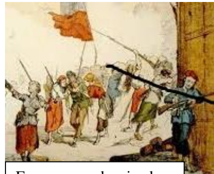
Femmes aux barricades

L'écrivain Victor Hugo dira de la Commune : « Le cadavre est à terre, mais l'idée est debout »